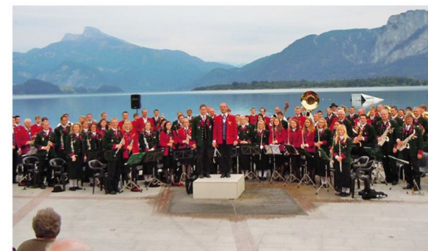
Klanggewaltig vor großer Kulisse: Gemeinschaftskonzert am 14. August

Einen musikalischen Höhepunkt im Sommer stellte einmal mehr das Gemeinschaftskonzert der Bürgermusik Mondsee mit der MK Tiefgraben dar. Am 14. August 2013 verschmolzen die beiden Kapellen an der Seepromenade zu einem rot-grünen Großklang-