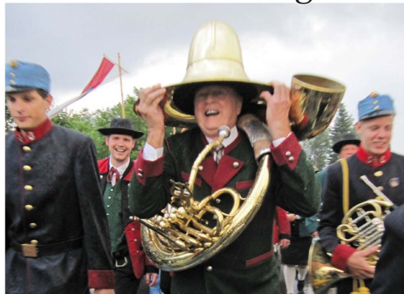
Effektiver Regenschutz: Warren's Sousaphon

Beim diesjährigen Bezirksmusikfest ging es feuchtfrohlich zu. 22 Musikvereine trafen am späten Nachmittag des 21. Juni 2013 in Ungenach zusammen, um die Marschwertung zu bestreiten. Als die Kapellen ihre Auftritte absolviert hatten, stellten sich kurz vor 20.00 Uhr alle Musikerinnen und Musiker zum Gesamtspiel mit Festakt auf. Was dann kam, war der wohl kürzeste Festakt der Blasmusikgeschichte: Während der ersten Takte der Eröffnungsfanfara fielen die ersten schweren